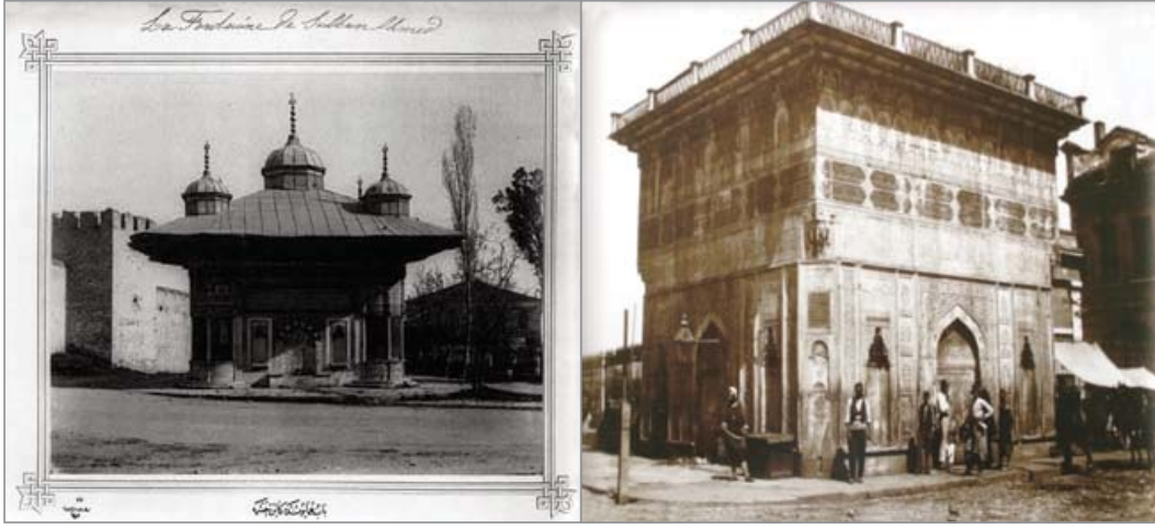
Fot. 1 9 : III. Ahmed Çeşmesi (1729) Fot. 2 0 : Tophane I. Mahmud Çeşmesi (1732)

Dört yüzlü çeşmeler, şehrin meydan olarak da değerlendirilebilecek açık alanlarında yapılmışlardır. Etrafı açık ve dört yönden algılanabilen bu çeşmeler, çevresinde dolaşılabilen yapılar olmasından dolayı mekân etkisi yaratmış, gündelik yaşamda ve mimarlık tarihi yazımında “ Meydan Çeşmeleri ” olarak tanımlanmıştır. Ancak bu çeşmelerin yapıldıkları alanların, dönemi içerisinde şehir meydanları olarak tanzim edilmediklerini, çeşmelerin yapılması ile bu alanlarda kendiliğinden ve müdahalesiz oluşan meydan kültürünün geliştiği ve bunların çeşme meydanı olarak tanımlanması İstanbul’daki meydanlar açısından vurgulanması gereken önemli bir noktadır.