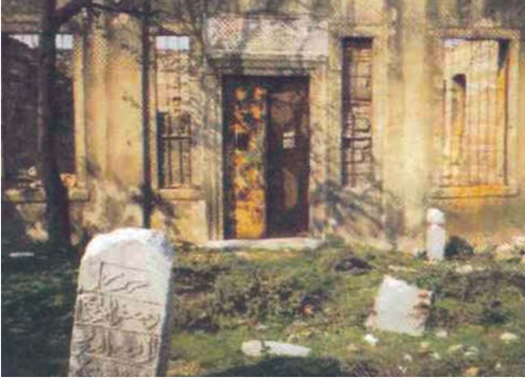
Resim 7. Emin Baba Tekkesinin 1994 Yılındaki Durumu 63