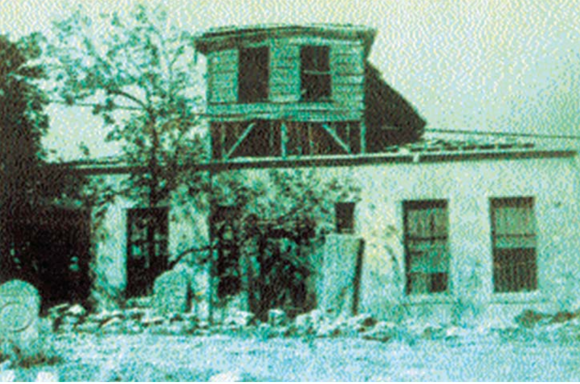
Resim 3. 1973 yılında Emin Baba tekkesi 59