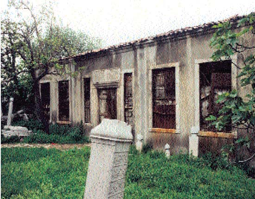
Resim 4. Emin Baba Tekkesi giriş cephesi (1990) 60