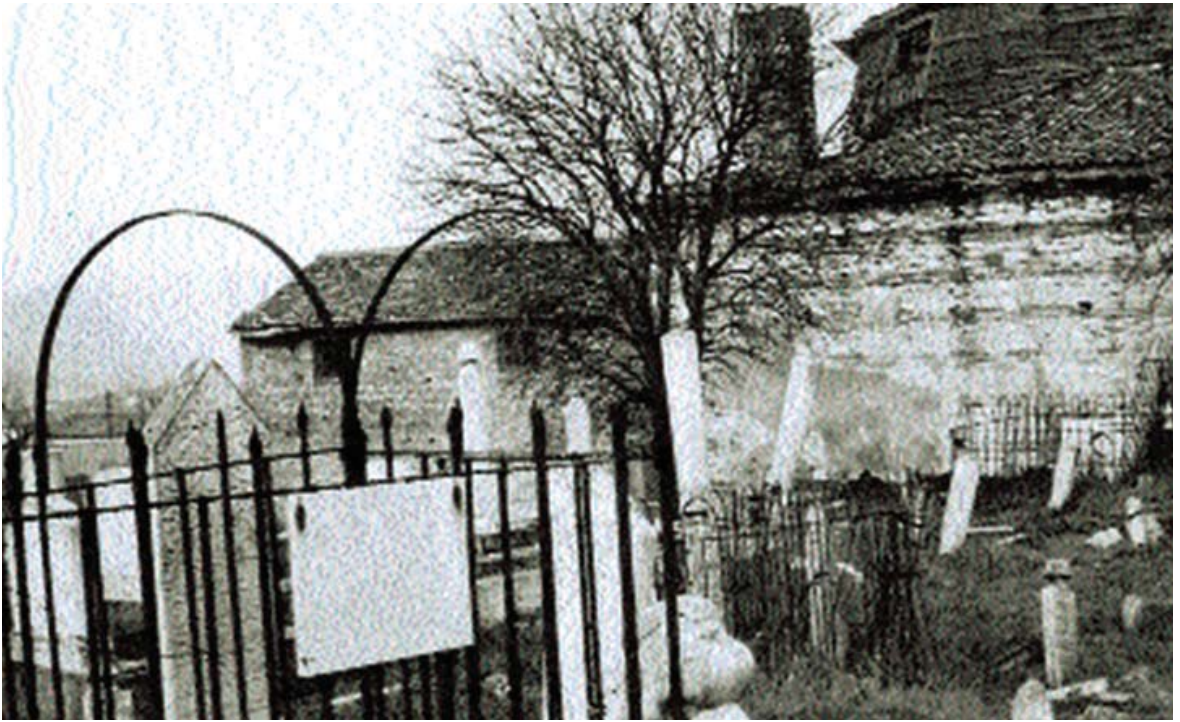
Resim 2. Emin Baba tekkesinin ve yanındaki hazirenin 1969 yılındaki görünümü. Arka planda tekkenin bugün mevcut olmayan ahır binası görülmektedir 58 .