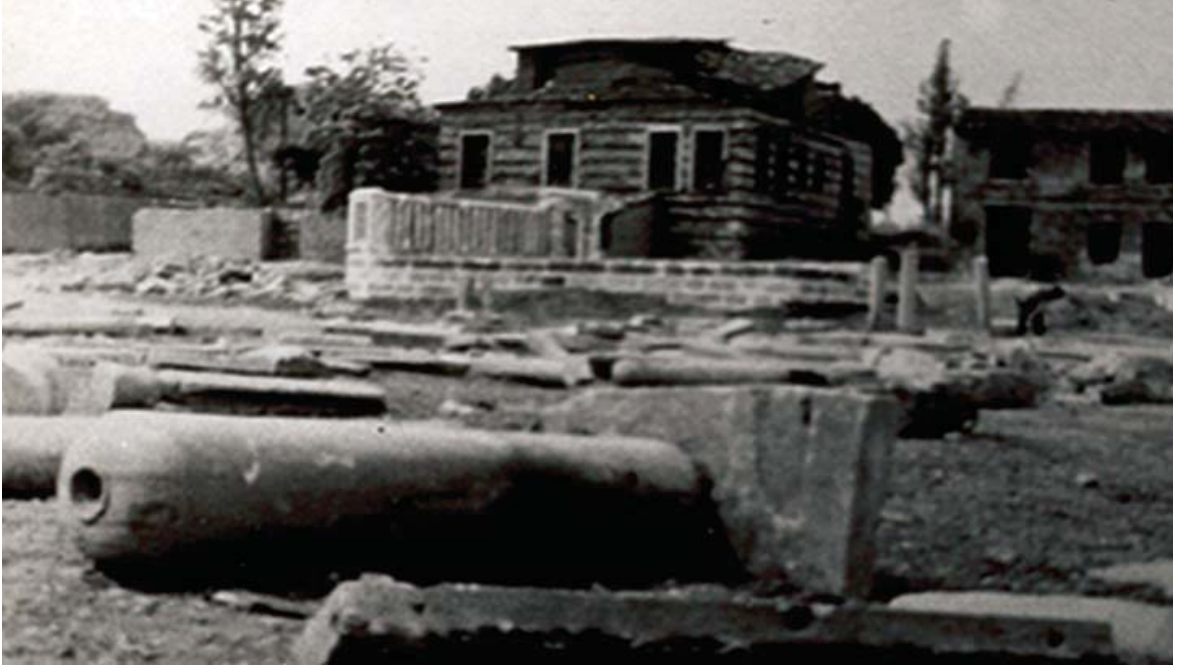
Resim 1. Emin Baba tekkesinin Rum mezarlığı yakınlarından görünüşü (1930)