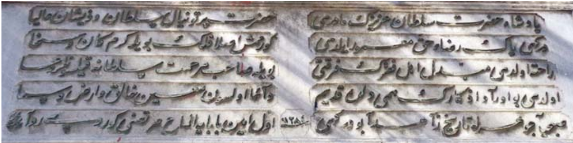
Resim 8. Emin Baba Tekkesi Kitabesi