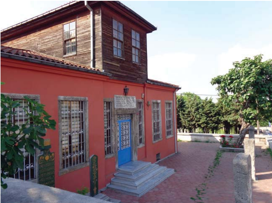
Resim 14. Emin Baba tekkesinin günümüzdeki hali.