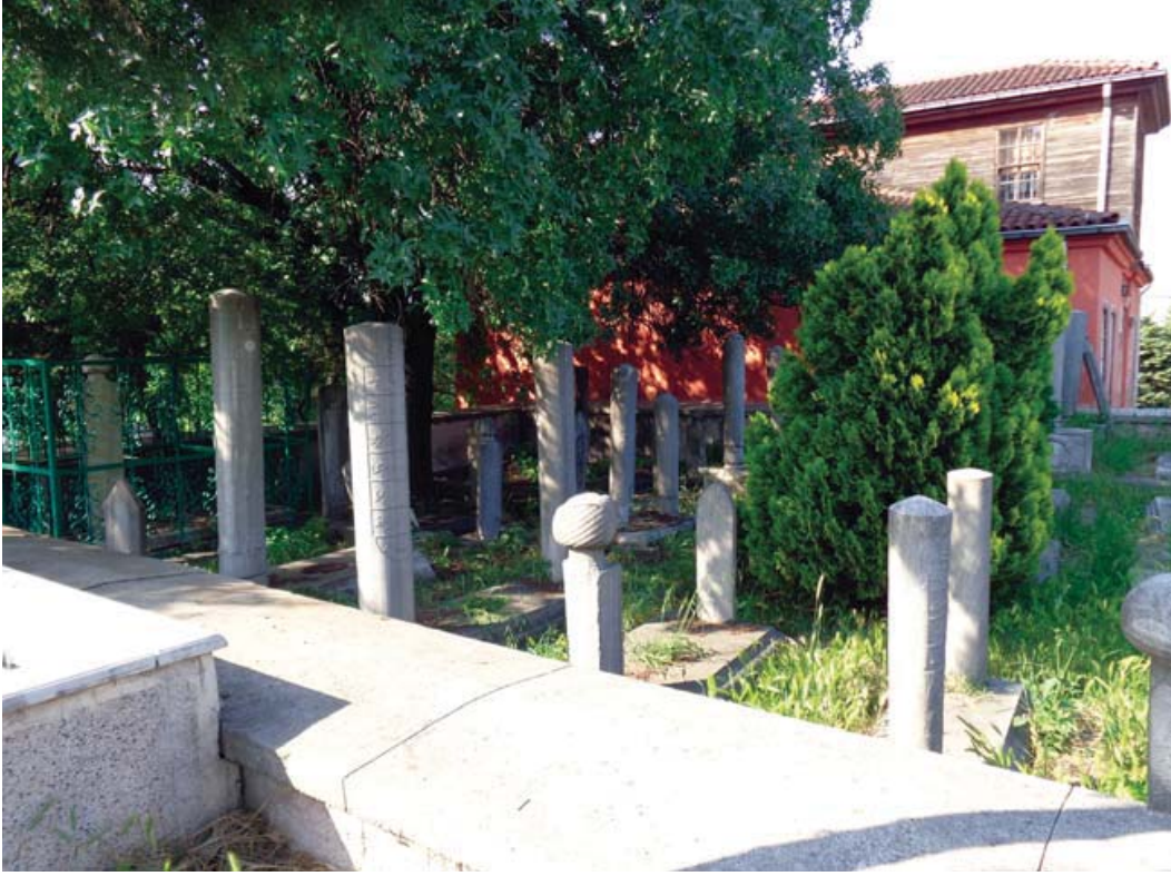
Resim 13. Emin Baba tekkesi haziresinin günümüzdeki hali.