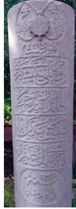
Resim 9. Emin Baba'nın Mezar taşı Kitabesi