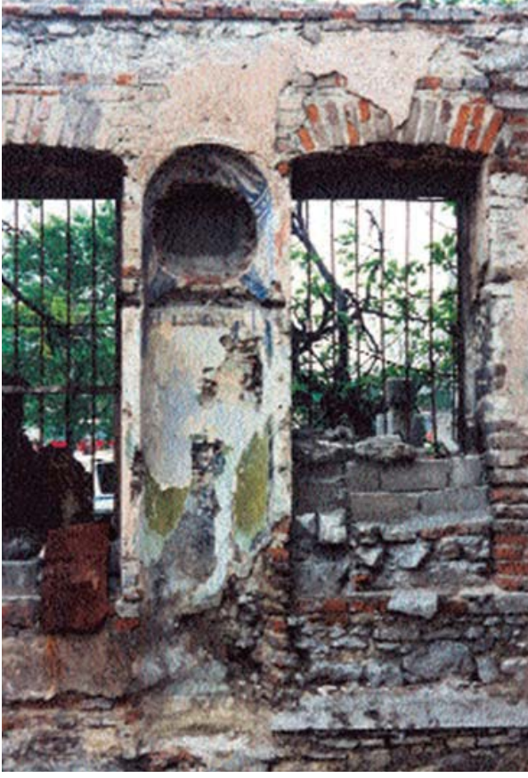
Resim 5. Emin Baba Tekkesi, tevhidhane mahallindeki mihrap nişi (1990) 61