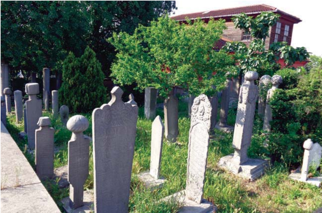
Resim 12. Emin Baba tekkesi haziresinin günümüz hali.