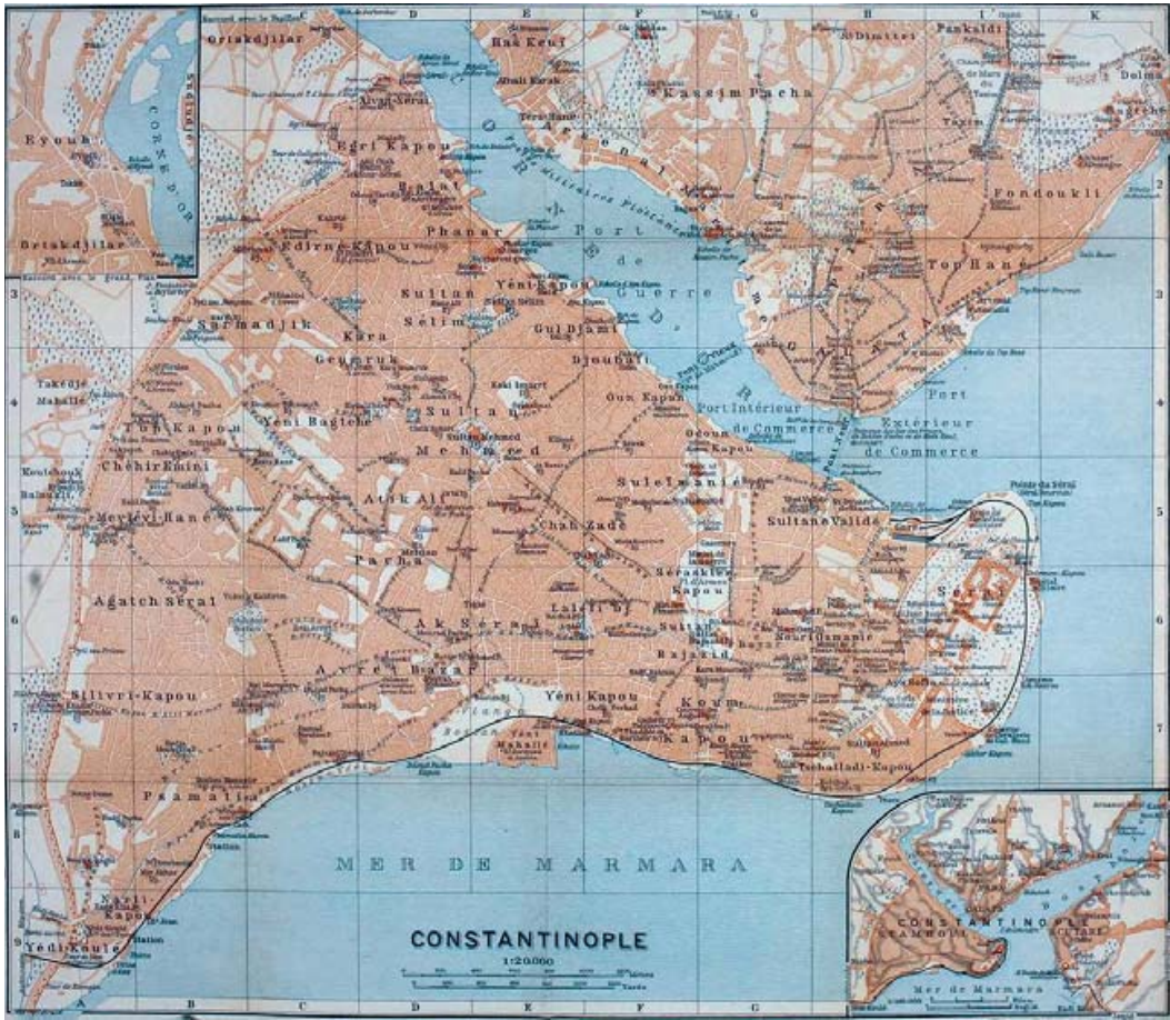
İstanbul Şehir Planı (Baedeker, 1911)

öğreniyoruz. Gazete, tütün, sigara ve puro çoğu küçük dükkânda, ayrıca Tütün Reji İdaresi'nin satış yerlerinde bulunmaktadır. Rehberlerde ayrıca, kitabevleri, fırınlar, pastaneler, şekerciler, saatçiler gibi diğer önemli dükkân ve mağazalar da belirtilmiştir. Turistlerin rehberlerde bulabilecekleri bir diğer bilgi de hamamlar ve deniz banyolarıdır. Hamamların muhtelif yerlerde olduğu ve bir Türk (Müslüman) eşliğinde gidilmesinin uygun olacağı önerisi yer almaktadır. Deniz banyoları içinse Prens Adaları tavsiye edilmektedir.