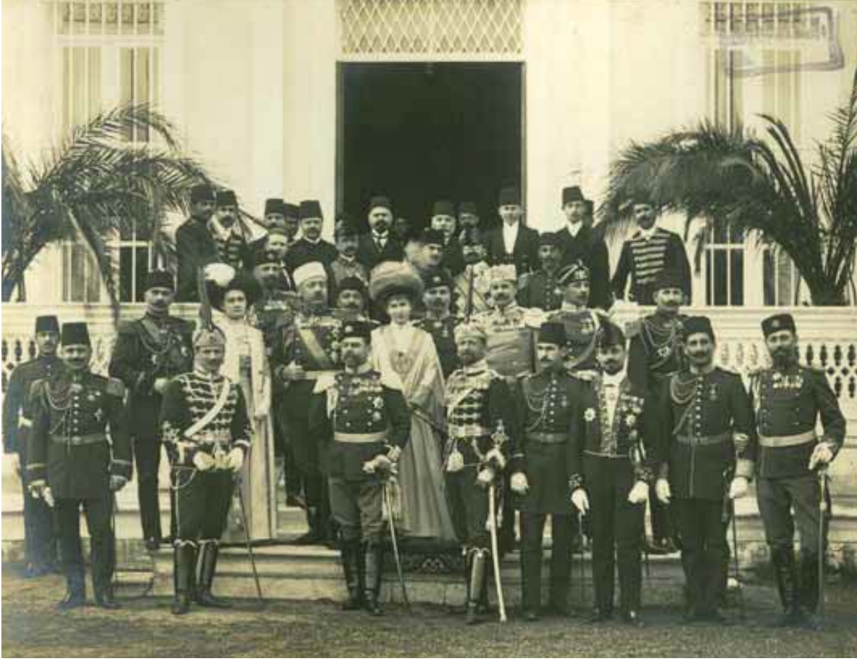
İstanbul'daki Bulgar ve Osmanlı heyetlerini bir arada gösteren fotoğraf.