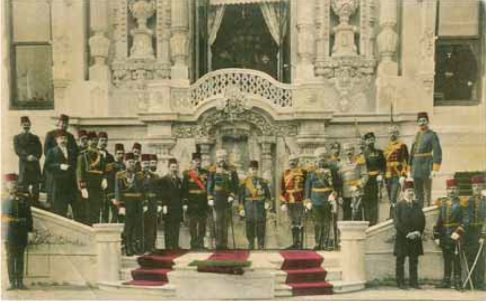
Çar Ferdinand ve Veliahd Yusuf İzzeddin Efendi'yi maiyetleri ile birlikte İhlamur Kasrı önünde gösteren kartpostal

Sv. Sv. Kiril ve Metodiy Ulusal Kütüphanesi, Sofya, C I 949.