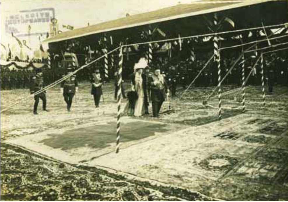
Sultan V. Mehmed Reşad, Çariçe Eleonore'a karşılama merasiminde eşlik ederken