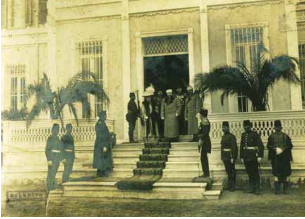
Çar Ferdinand ve Çariçe Eleonore