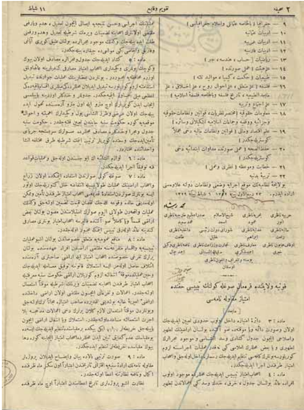
A.DVN.MKL 57_20_2.Takvim-i Vekayi'de yayımlanan Medresetülvaizin Nizamnamesi