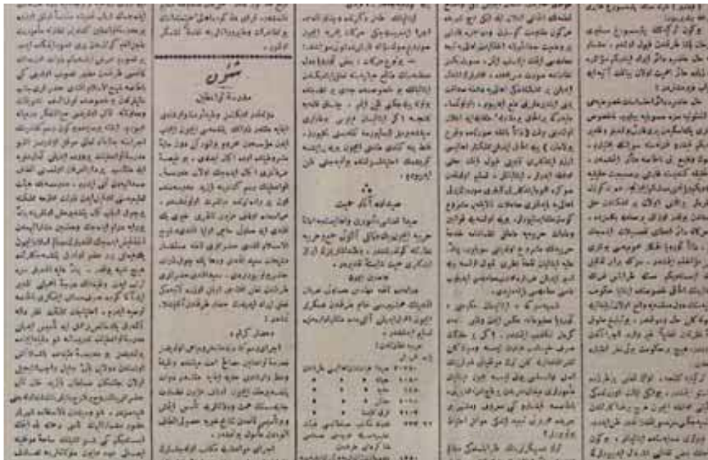
Tanin Gazetesi Medresetülvaizin açılış haberi

Medresetü'l-vâizîn, bir müdürün idaresinde ve sınıf geçme sisteme dayanan bir medrese olduğundan, dersiamların görevleri artmış ve çeşitlenmiştir. Bu medresedeki müstakil birçok derse genellikle dersiamlar girmiştir. 37 Muallim tayinleri Evkaf Nezareti tarafından yapılmıştır. 38