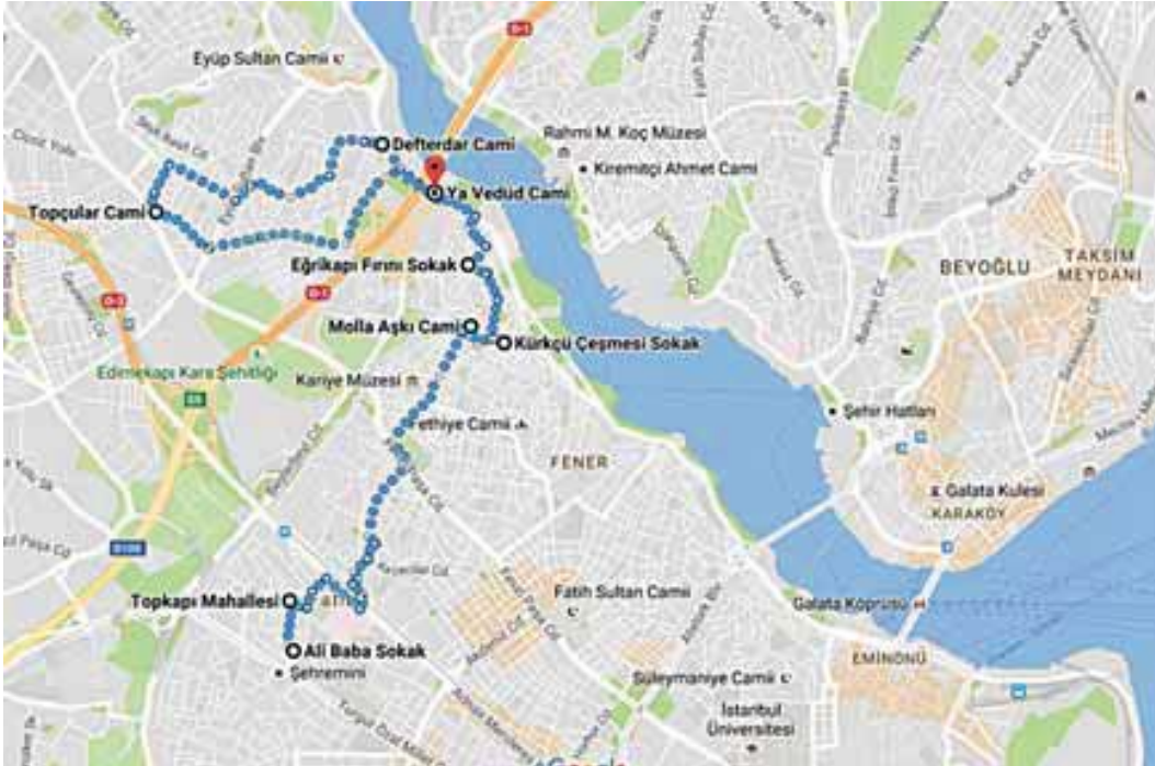
Şekil 4: Hadice Sultan'ın Mülk ve Vakıflarının Bulunduğu Semt/Mahalle