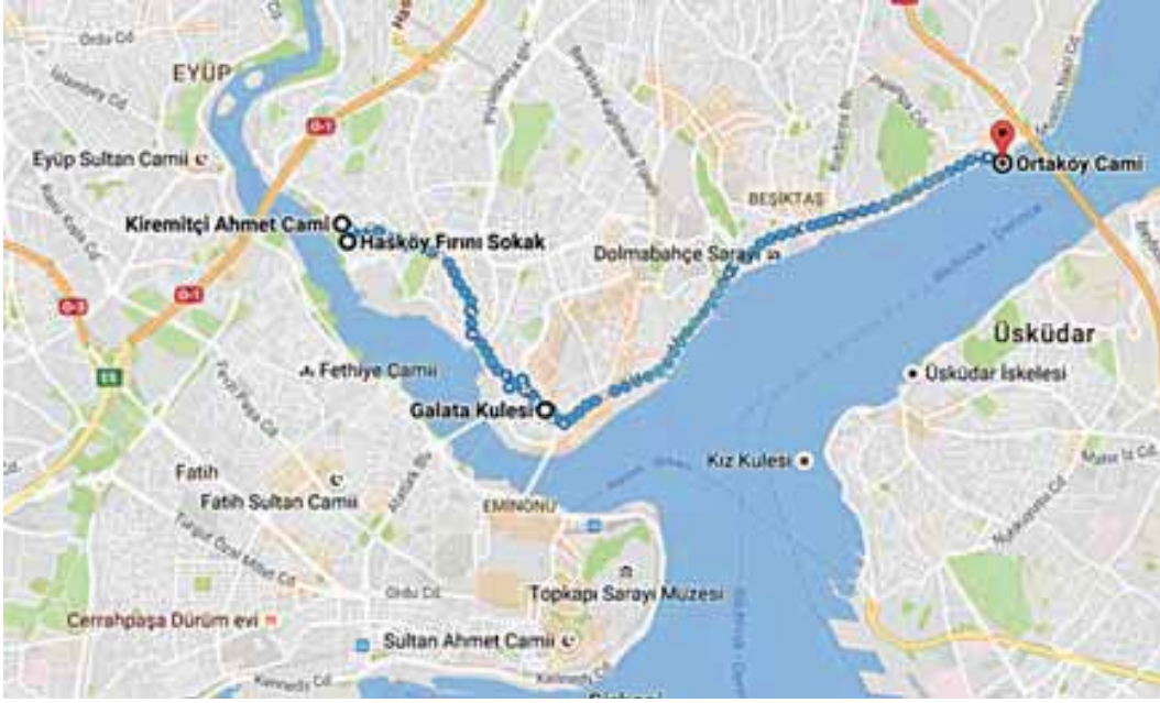
Şekil 5: Hadice Sultan'ın Vakıflarının Bulunduğu Semt/Mahalle