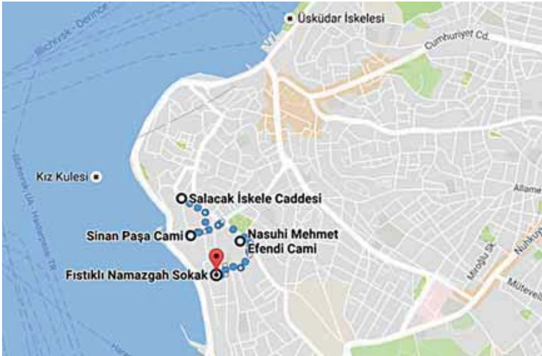
Şekil 6: Hadice Sultan'ın Vakıflarının Bulunduğu Semt/Mahalle