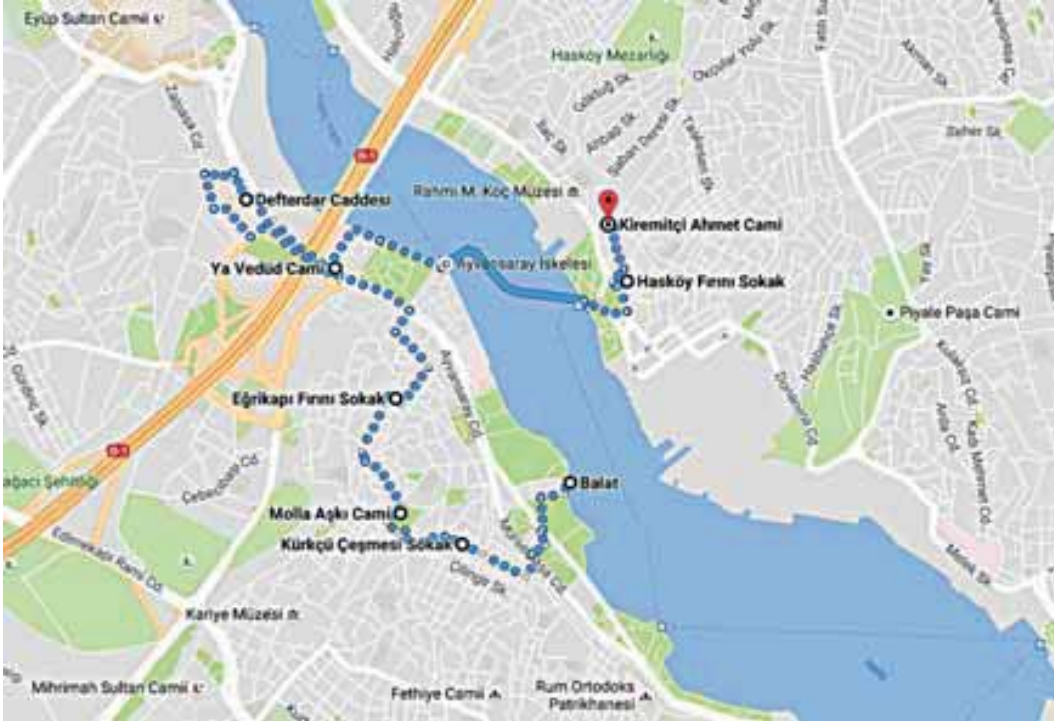
Şekil 3: Hadice Sultan'ın Mülk ve Vakıflarının Bulunduğu Semt/Mahalle