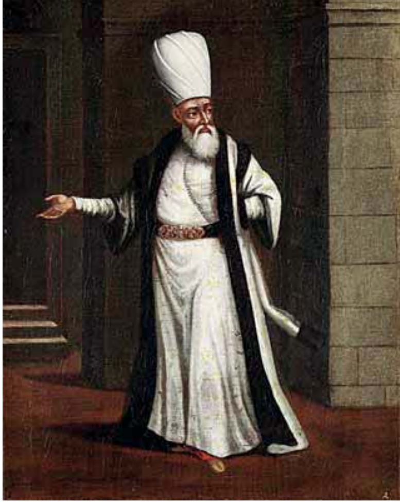
Resim 5. J. B. Vanmour'a ait yağlıboya bir resimde Yeniçeri ağası. Rijksmuseum, S.K.-A.2025

gerçekleştiğini ve olup-bitenlere tam olarak hangi sûistimal-lerin sebebiyet verdiğini göstermesi bakımından son derece önemlidir.