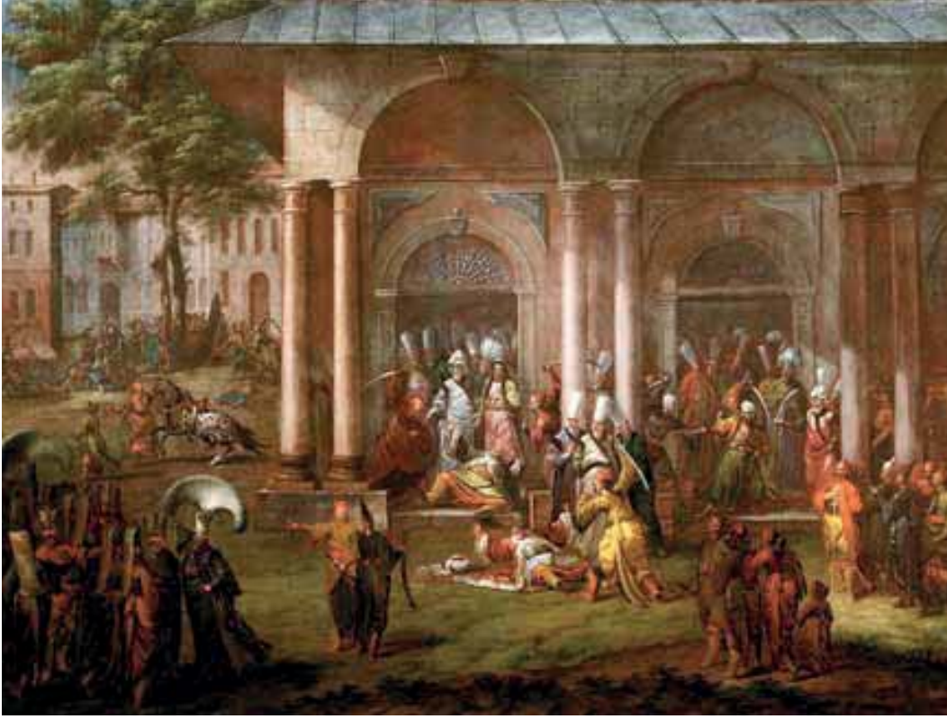
Resim 7. Patrona Halil'in, Kul Kethudâsı Muslı Beşe, Yeniçeri Ağası Mehmed Ağa ve diğer zorbarlarla birlikte Sofa'-yı Hümâyûn'da düzenlenen tertiple ortadan kaldırılışı. Jean Baptiste Vanmour, Rijksmuseum, nr.: S.K.-A.2012.