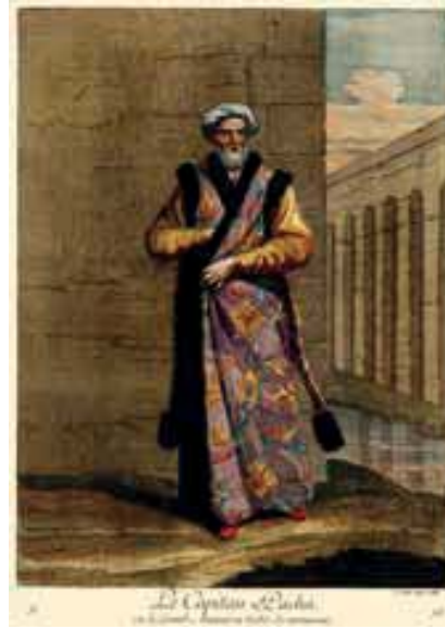
Resim 3-4. Kırım hânı Kaplan Giray Hân'ın Kırım/Bahçesaray'daki Han-sarayı'nda yaptırdığı Altın Çeşme (solda); Çağdaş Flaman ressam Jean Baptiste Vanmour'un çizimine göre Kaptan-ı Deryâ (sağda). Recueil de cent estampes représentant différentes Nations du Levant (1712-1713), nr.: 36, Paris 1714.