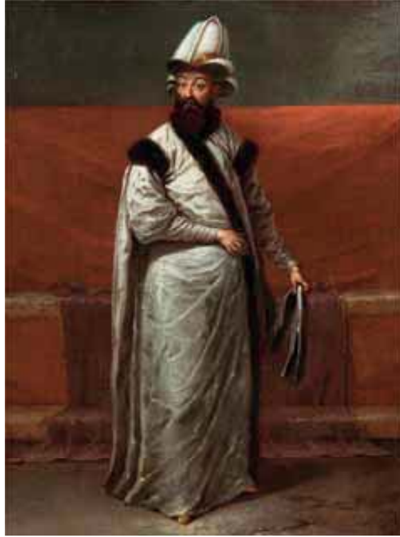
Resim 2: Ünlü Flaman ressam Jean Baptiste Vanmour'un fırçasından sadrâzam Nevşehirli Dâmâd İbrâhîm Paşa. Rijksmuseum, S.K.-A.2017.