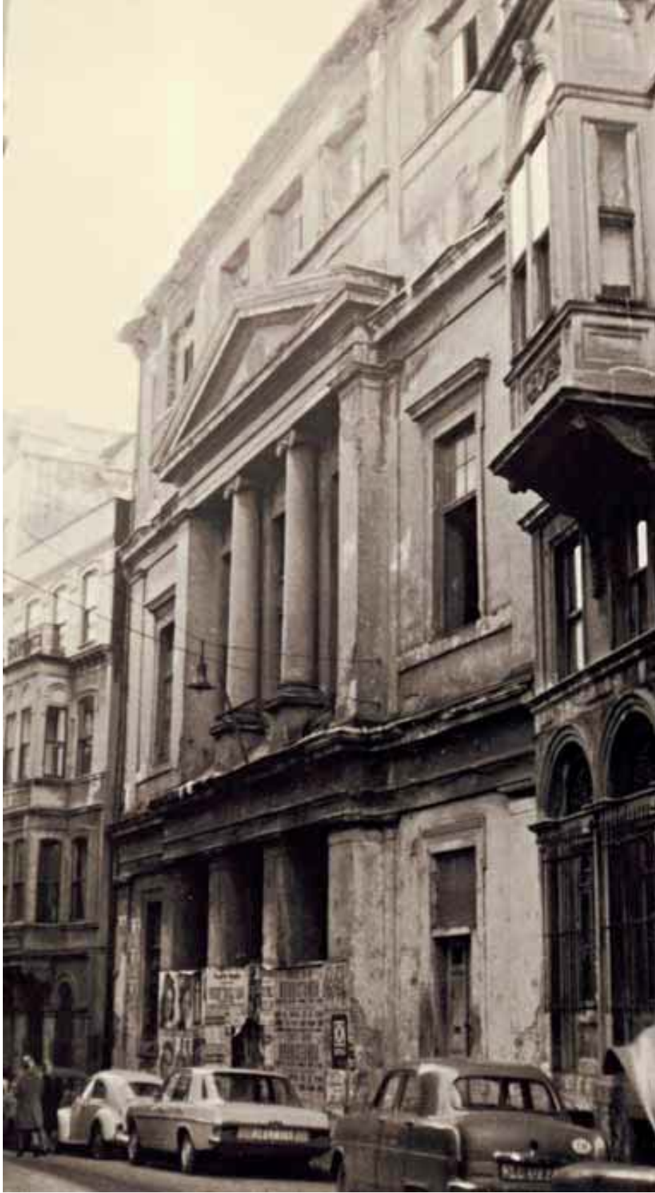
Resim 1. Dersaadet Rum Cemiyet-i Edebiye binasının 1960'lı yıllarında yıkılmadan evvelki hali