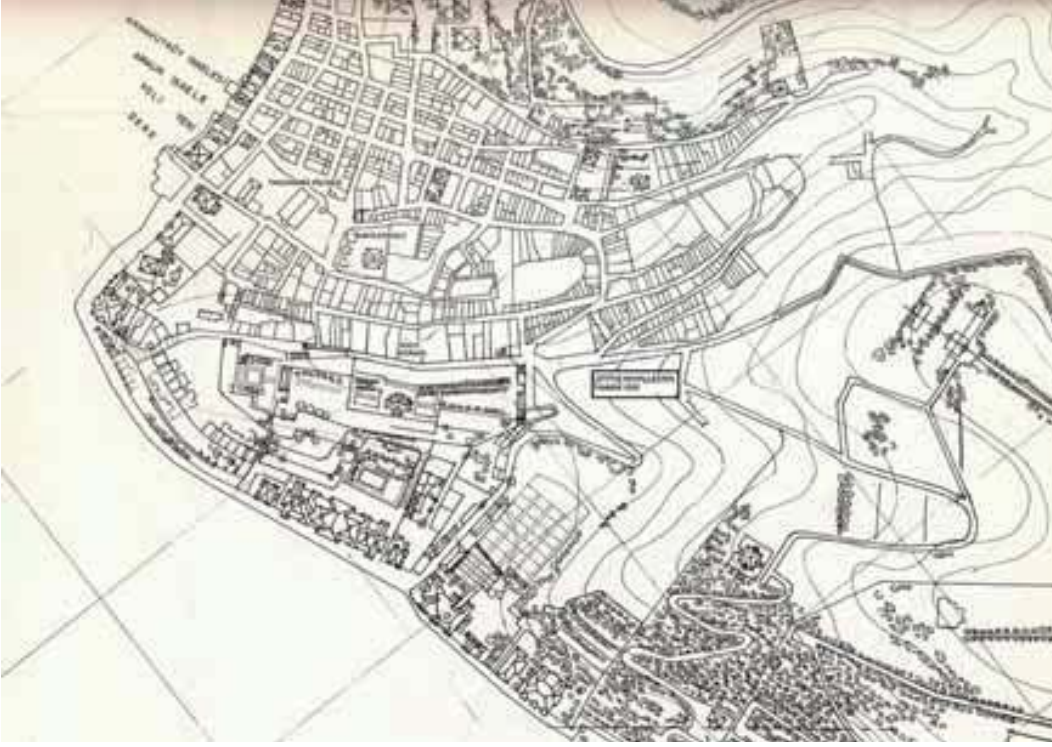
Resim 9. Arnavutköy Vaziyet Planı, S. H. Eldem, Boğaziçi Yalıları , I, 95

Hamid'in tahta çıktığı gün tamamlanmıştır. Köydeki Taksiarhes kilisesinde (Resim 9) yapılan «Sultanın üstüne sağlık olsun» vb. ifadeler içeren Şükür Ayini'nden sonra kalabalık kilise cemaati bölgedeki Erkek İlkokulu'nun salonuna doluşmuştur. Bu salonda Kilise Mütevelli Heyeti ve o anda okulda hazır bulunan bölgenin tanınmış şahsiyetleri tarafından 24 bir çeşit sözleşme yerine geçen «protokol» imzalanmıştır 25 . Protokole göre bir bakkal dükkanına sahip 15 tuğla ve iki ahşap ev; 50 oda, 18 mutfak, kanalizasyon sistemine sahip 18 tuvalet ve banyo alanı ve gerekli depo alanlarını içermekte olup projenin tatmin edici bir biçimde tamamlandığına dair ortak bir karara varmışlardır. Bu sebeplerden ötürü söz konusu olan 17 yapıyı sapa sağlam, el değmemiş ve eksiksiz bir biçimde teslim aldıklarını onayladıktan sonra aşağıdaki noktalara vurgu yapmışlardır;