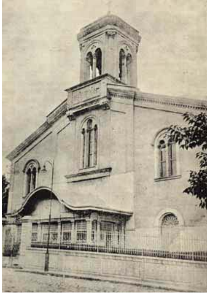
Resim 9. Taksiarhis Rum Ortodoks kilisesi (1949), Genadiusun kitabından

Kartheodoris bu tarz düşüncelerden yola çıkarak, her aileye 4-5 lira verilmesinin -Kilise Mütevelli Heyeti tarafından tahsil edilenlere göre yangınzedelere bu miktar karşılık gelmektedir- genel mutsuzluğu ve Arnavutköy (Resim 10) gibi bir çok banliyöde bu şekilde yaşayan felakete uğramışların yoksulluğunu azaltmayacağını itiraf etmektedir (Resim 11).