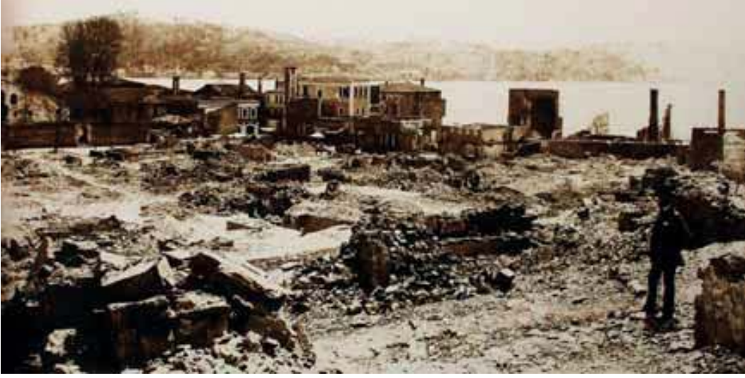
Resim 4. Arnavutköy'de harabeye dönmüş evler, wow.Turkey.com