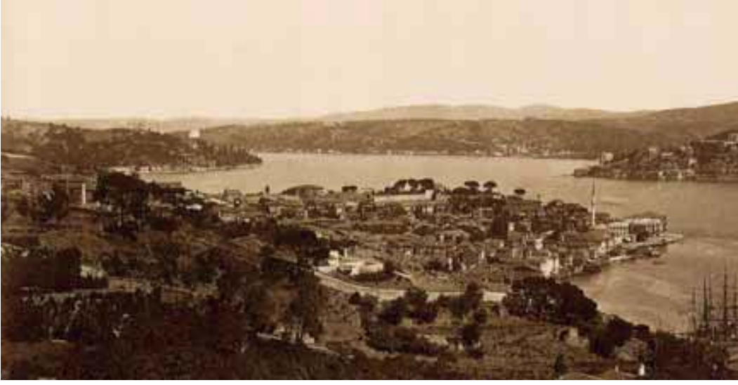
Resim 2. Sarrafburnu sırtlarından Arnavutköy (1870), Konstantiniyye'den İstanbul'a , 89.

türlerde hayır kurumlarının inşasına yöneltiyordu. Buna referans olarak Aydın Talay'ın, Eserleri ve Hizmetleriyle II. Abdülhamid 11 kitabından faydalandım.