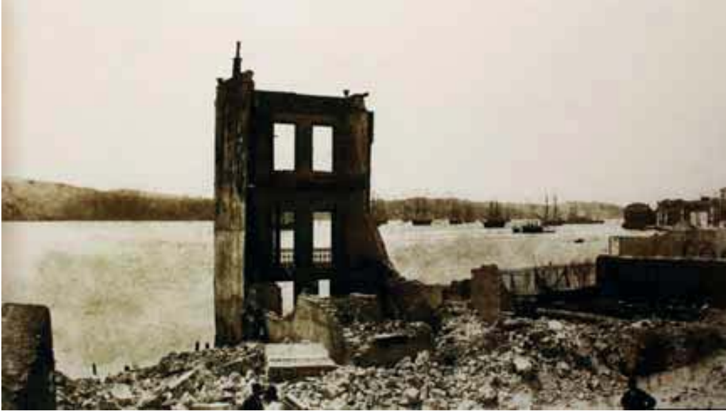
Resim 4a. Yangın bölgesinden Boğaz tarafı bakışı (doğu), wow.Turkey.com