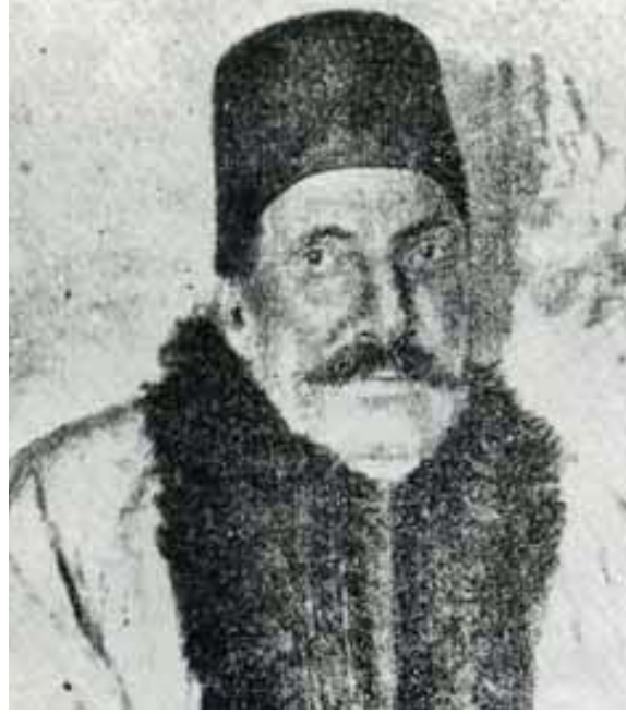
Resim 6. Mimar Vasilaki Efendi Ioannidis

kullanılması niyetinde olduğunu belirtmiştir. Kendisine 15/27 Mayıs 1887 tarihli verilen cevapta 19 , Kilise Mütevelli Heyeti, artık evsiz kalmış, gece ve gündüz boyunca çadırlarda yaşamak zorunda kalan yangınzedelere ev inşa edilmesi için arazi tahsis ettiğini belirtmiştir. Kilise Mütevelli Heyeti ilgili yazıda, inşa ruhsatının gecikmesi ile ilgili çekincelerini belirterek, Lady Catherine White'ın sahip olduğu imkânlar dahilinde ruhsatın daha hızlı bir biçimde çıkarılması için çabalamasını rica eder.