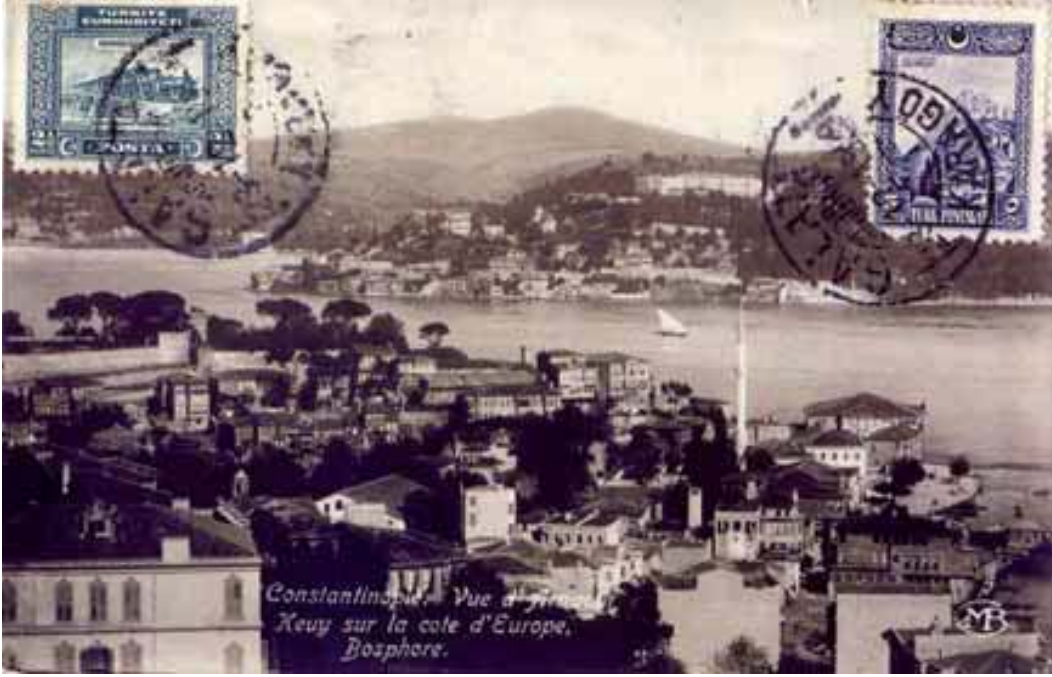
Resim 10. 20. yy. başlarında Arnavutköy

ve bu evlerde yaşayan ailelerin kira masrafları çerçevesinde toplam olarak 1600 altın lira harcamaları gerektiğini kanıtlamıştır (8 lira x 50 aile x 4 yıl) 27 . Bu sermaye, Kilise Mütevelli Heyeti'nin topladığı ve projenin başlangıç yatırımını oluşturan 1.359,10 lirayı aşılıyordu. Cemaat, bu sermayeyi sağlamanın yanı sıra, 4 yıllık sürenin geçmesinin ardından okul binaları için bir ek gelire sahip olacaktı.