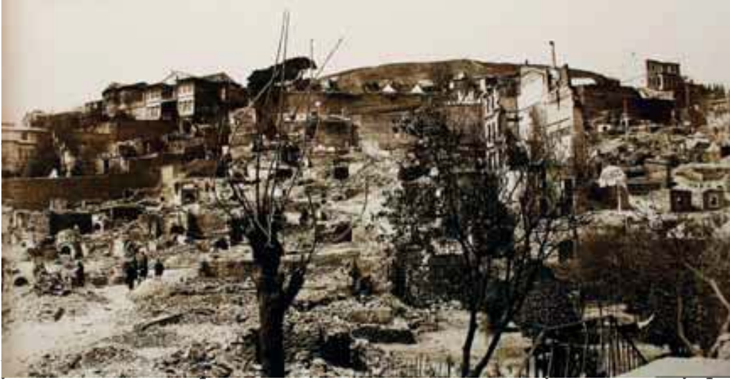
Resim 4b. Yangın bölgesinden tepe tarafı bakışı (batı)

lacak evlerin toplam yüzölçümü 1,000 arşın metrekareye (562,50 metrekare) sahip olacaktı.