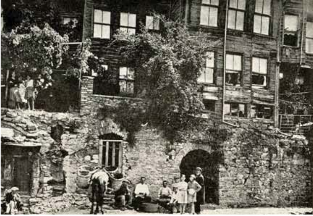
Resim 11. Arnavutköy'de Sucos Konağı'nın 20. yy. ortalarında hali (1949), Gennadiosun kitabından

gösterdiğini, yangınlardan o ana kadar uygulanan tüm sistemlerin apaçık kusurlara sahip olduğunun göze alınması gerektiğini ve sonuç olarak izlenen yenilikçi ve cesur yöntem için ufak bir hoş görünün istenmesinin haksız olmayacağını vurguluyor.