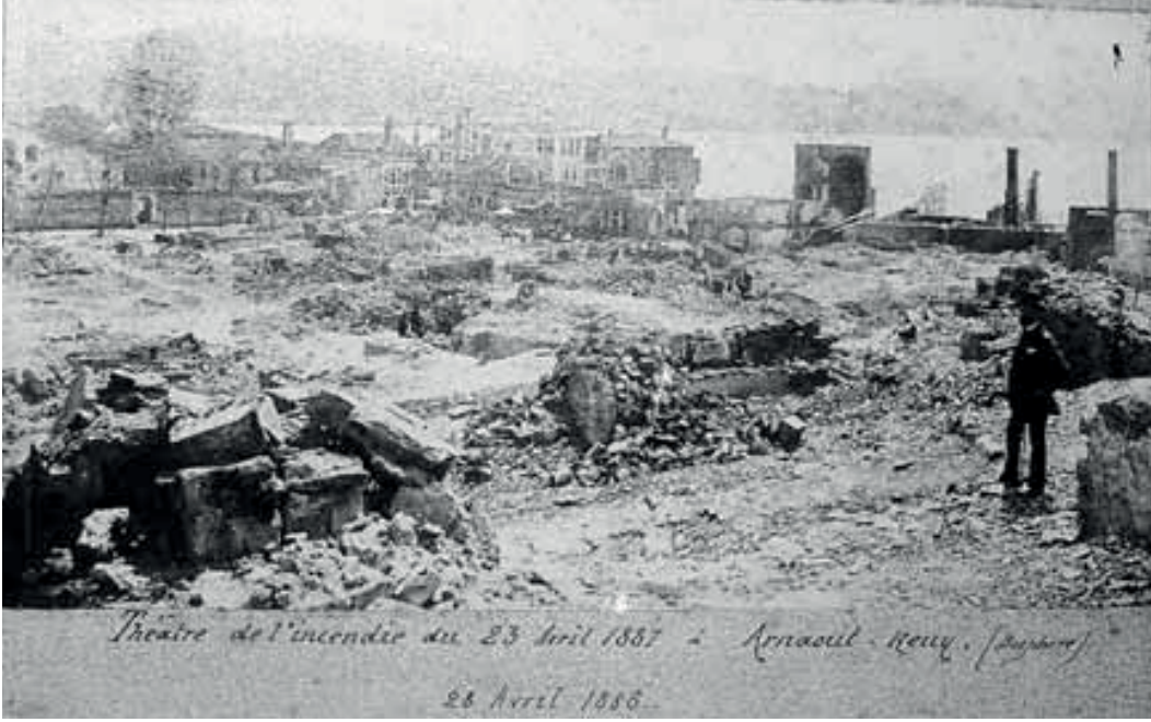
Resim 3. Arnavutköy yangın sonrası bölgesi, 1887, Konstantiniyye'den İstanbul'a

okul seviyesinde), bir öğretmen ve iyi öğrenciler tarafından eğitim verilen çok sınıflı bir interaktif okul (interactive school) ve bir kız okulu ile ön plana çıkmaktadır. Zografos aynı zamanda Yunan dilini konu alan çalışma ve araştırmaları desteklemesinin yanında İstanbul Helen Edebiyat Cemiyeti'nde «Zografion Yarışması»nın kurumsallaşmasını sağlamıştır. İstanbul'da kendisinin adını taşıyan okullar meşhurdur.