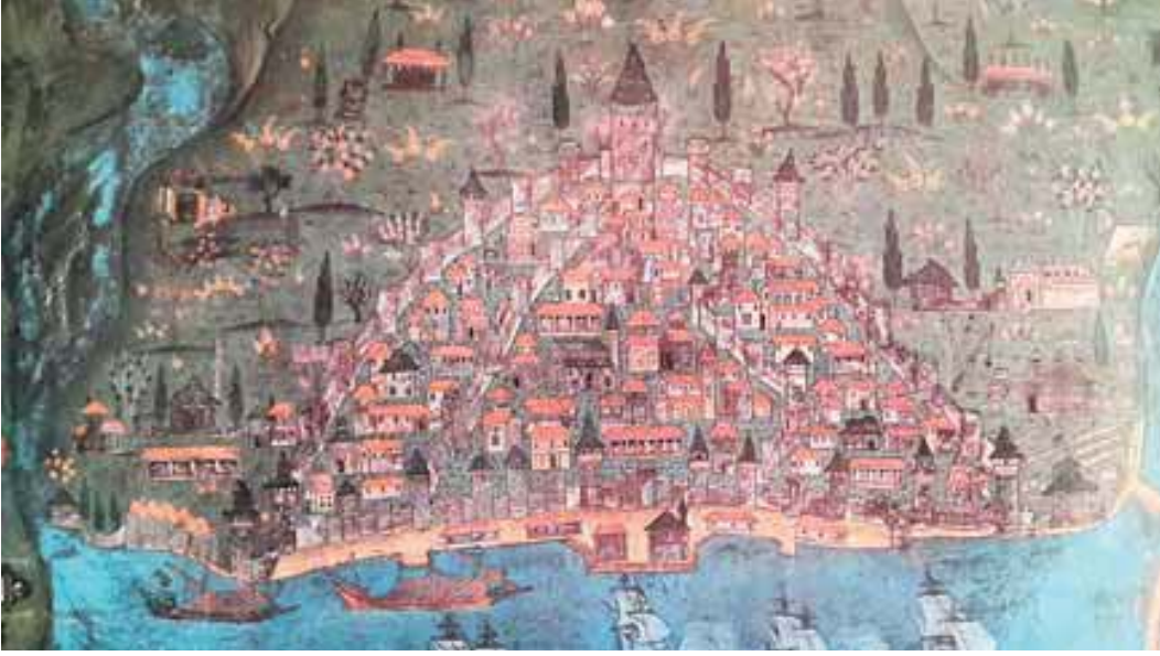
Şekil 6. İstanbul'un Matrakçı Nasuh tarafından yapılan resmi (Galata kısmı)