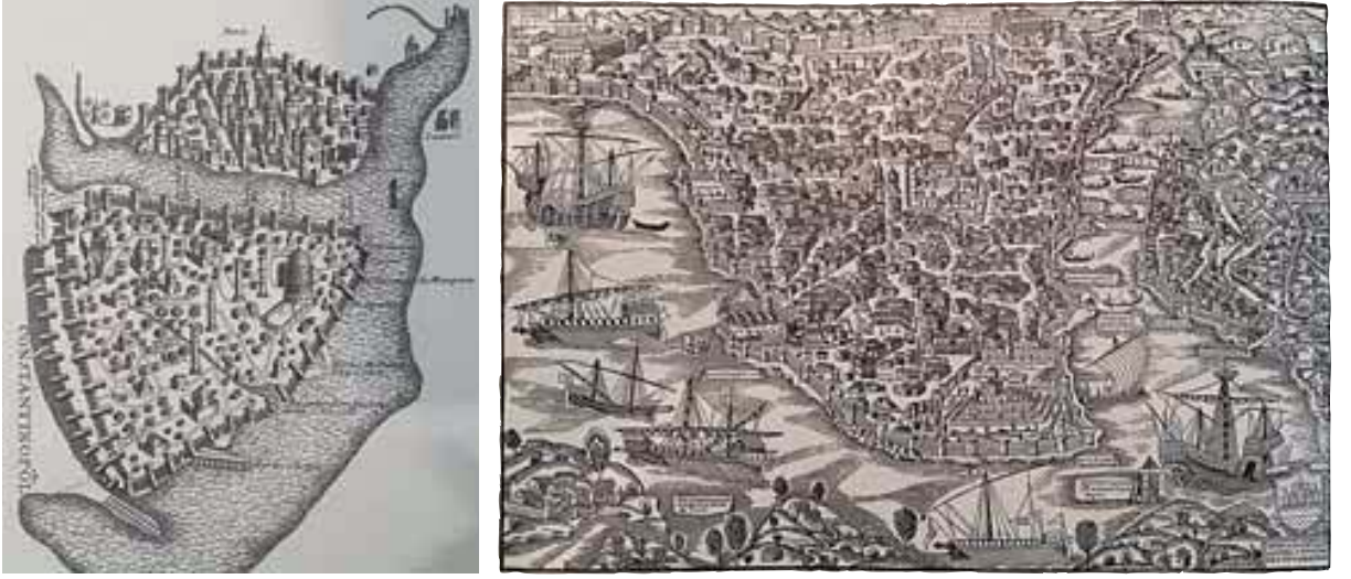
Şekil 3-4. İstanbul'un 1420 tarihli Buondelmonti tarafından yapılan resmi ile 1520 tarihli Vassore çizimi