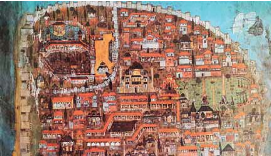
Şekil 5. İstanbul'un Matrakçı Nasuh tarafından yapılan resmi (Kostantiniyye kısmı)